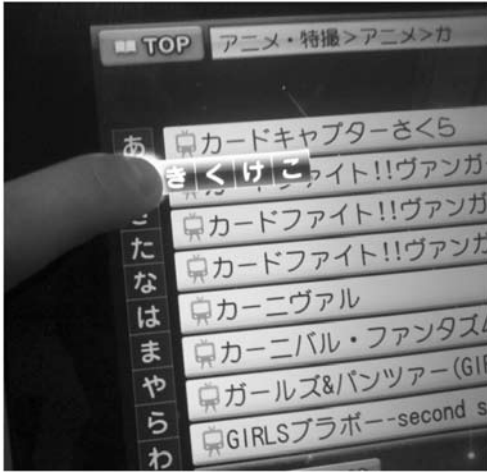
図3 『か』を長押しすると『きくけこ』が出る。

Dr. N 「古いとは失礼な。私だってスマートホンは使ってますよ。ちなみに、スマートホンのあれは、押した瞬間に候補が出てくるので『長押し』とは違います。あと、キーボードの並びもテンキーでは無く縦並びなので、気づかせるのは難しいと思いますよ」