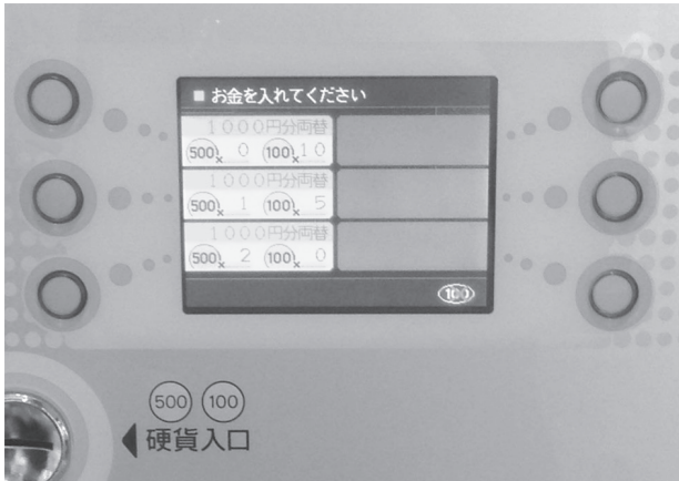
図1 両替機 (兄)