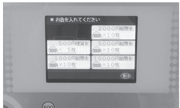
図2 こっちは弟。よく似た画面ですが…

Dr. N 「あれ? あなたはボタンがないんですね。どうやって両替したらいいんですか?」