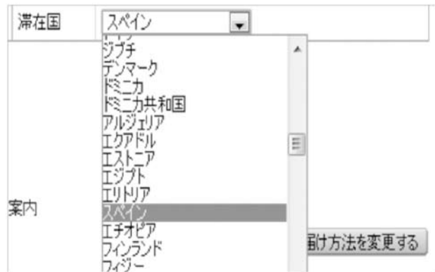
図3 スペイン (España) はこんなところに…