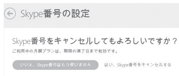
図2 『いいえ』なのにもう使わない?

患者 B「おはようございます。私も、とあるアプリのダイアログボックスです。ユーザさんから訳が分からないと文句をもらうことが多いので診てください (図2) *1」